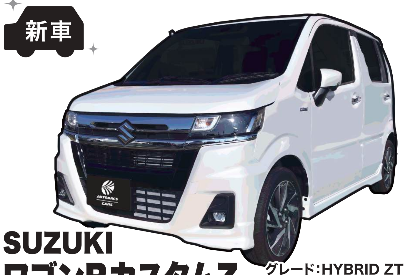
SUZUKI ワゴンRカスタムZ グレード:HYBRID ZT 色:ピュアホワイトパール ※1 燃料消費率(国土交通省審査値):22.5km/L(※2 WLTCモード)