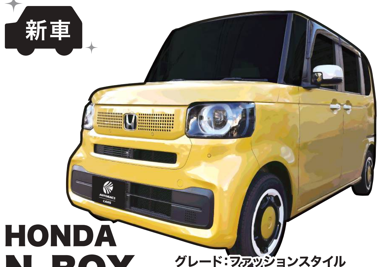
HONDA N-BOX グレード:フュージョンスタイル 色:オータムイエロー・パール ※1 燃料消費率(国土交通省審査値):21.6km/L(※2 WLTCモード)