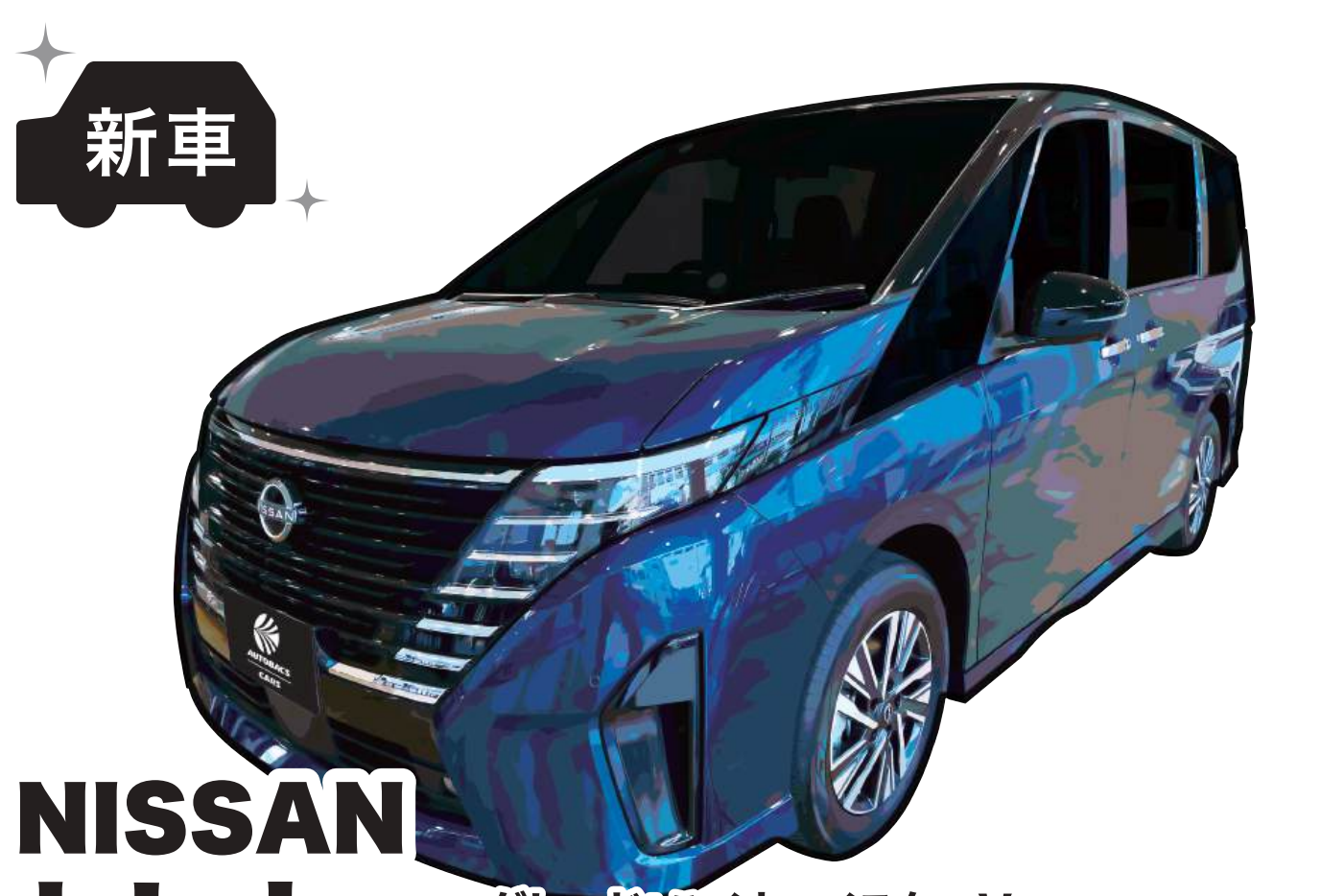
NISSAN セレナ グレード:ハイウェイスターV 色:アズライトブルー ※1 燃料消費率(国土交通省審査値):13.0km/L(※2 WLTCモード)