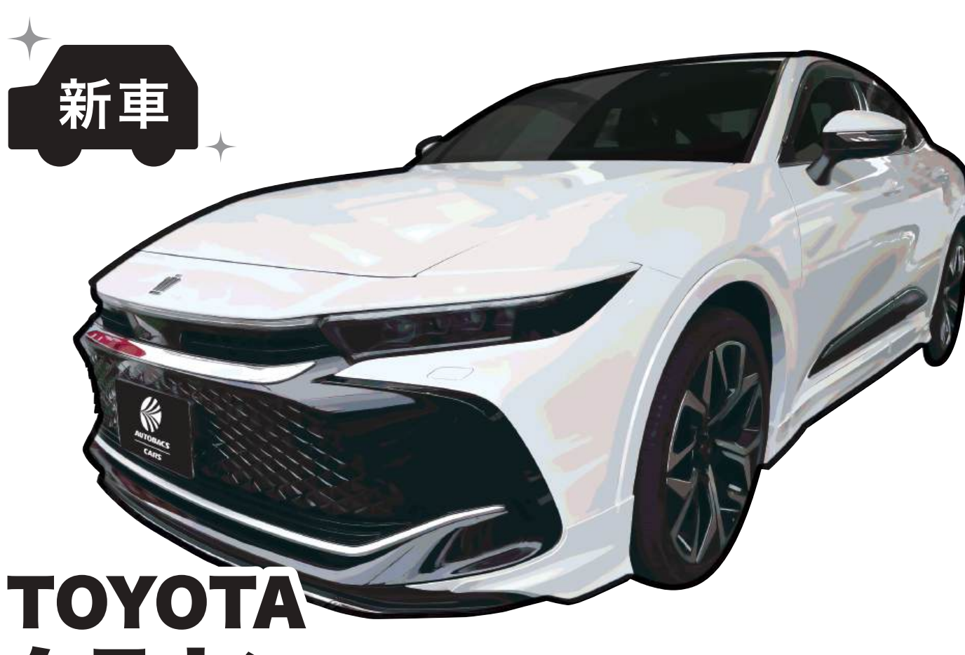
TOYOTA クラウン グレード:CROSSOVER Z 色:プレジヤスホワイトパール ※1 燃料消費率(国土交通省審査値):22.4km/L(※2 WLTCモード)