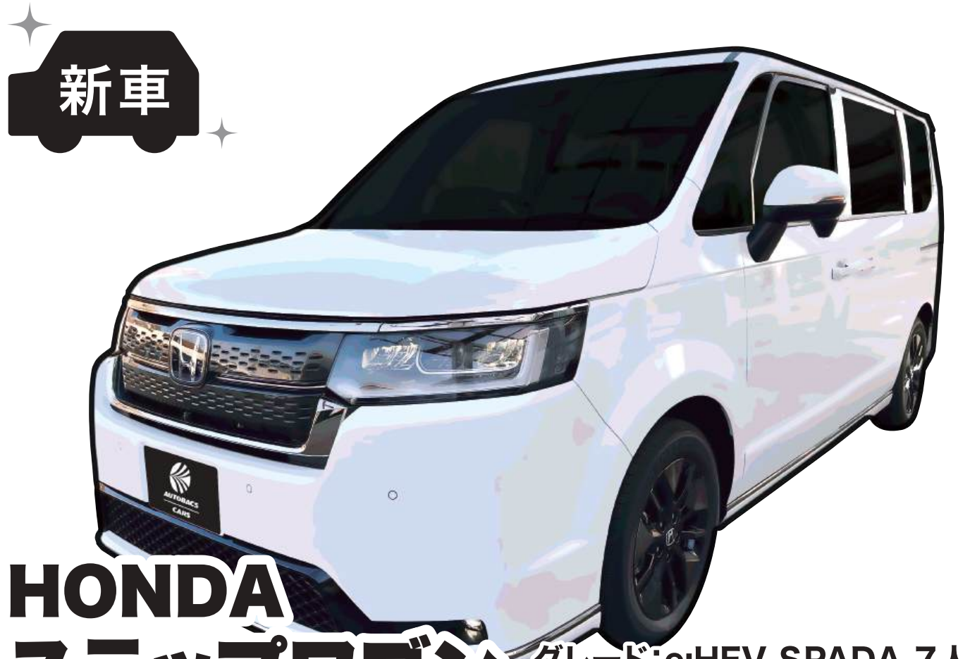
HONDA ステップワゴン グレード:e:HEV SPADA 7人乗り 色:プラチナホワイト・パール ※1 燃料消費率(国土交通省審査値):19.6km/L(※2 WLTCモード)