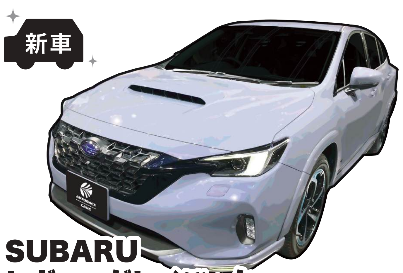
SUBARU レヴォーグレイバック グレード:Limited EX 色:アイズシルバー・メタリック ※1 燃料消費率(国土交通省審査値):13.6km/L(※2 WLTCモード)