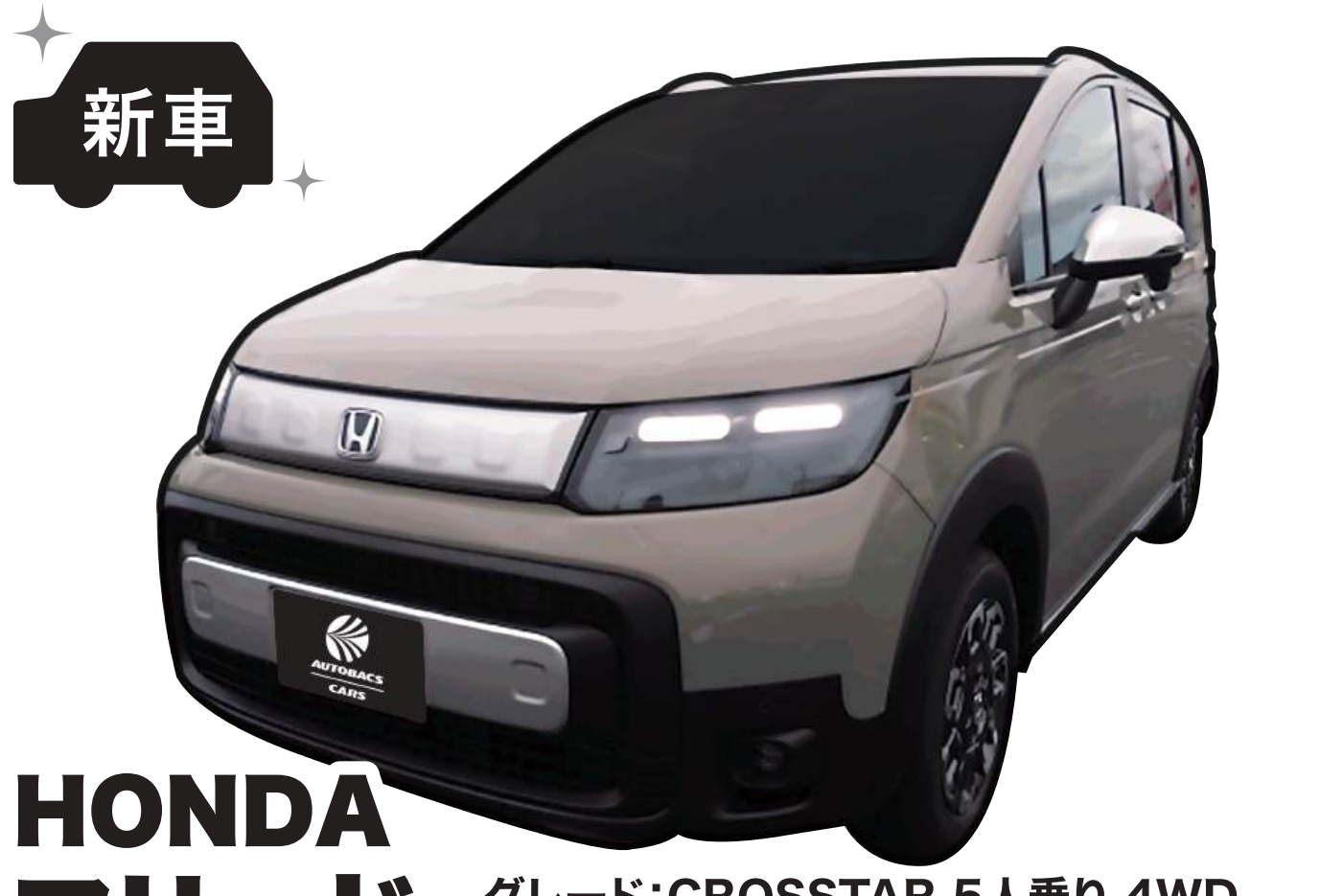
HONDA フリード グレード:CROSSTAR 5人乗り 4WD 色:デザートベージュ・パール ※1 燃料消費率(国土交通省審査値):14.4km/L(※2 WLTCモード)