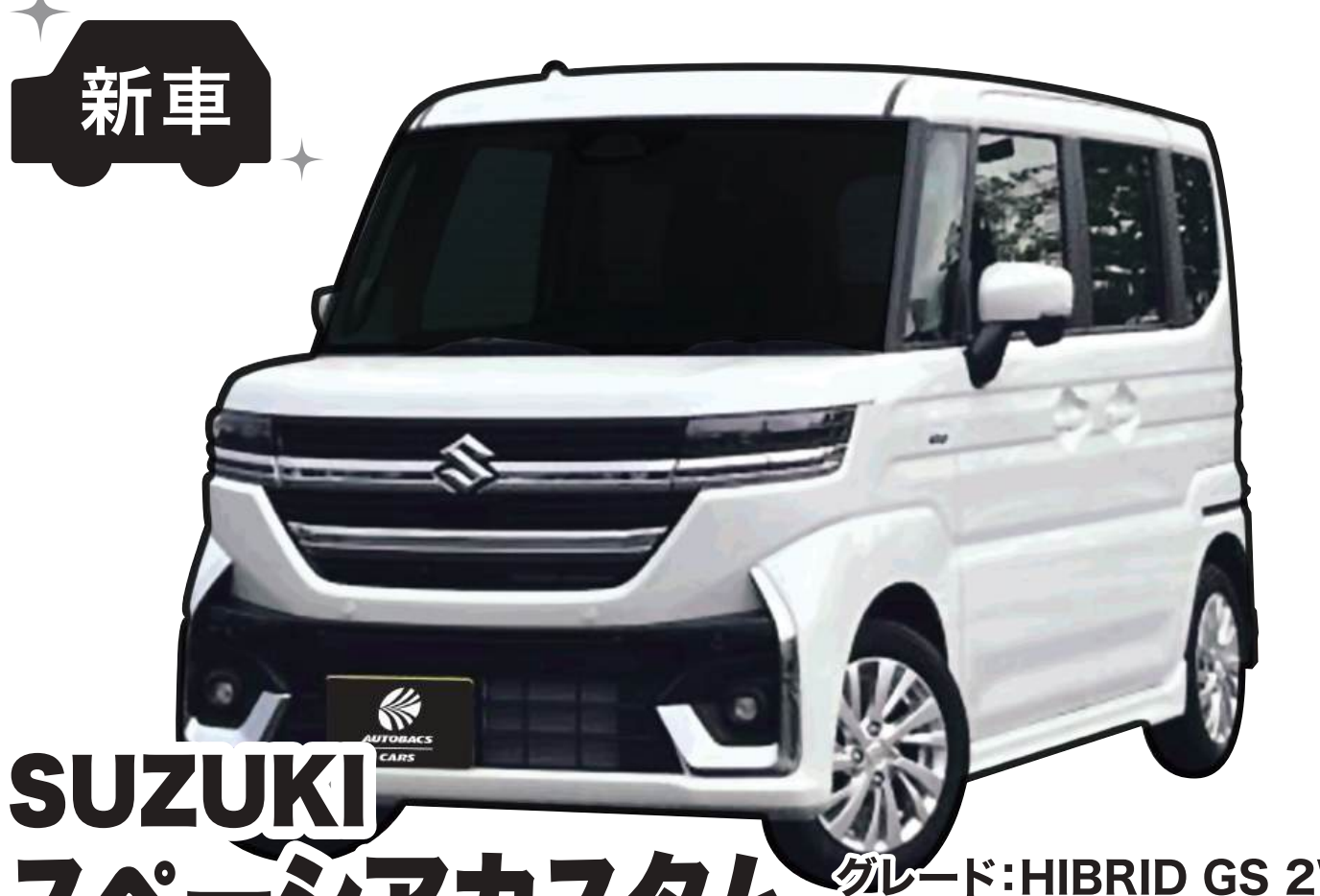
SUZUKI スペーシアカスタム グレード:HIBRID GS 2WD 色:ピュアホワイトパール ※1 燃料消費率(国土交通省審査値):23.9km/L(※2 WLTCモード)